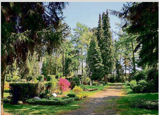
Welche Bestattungsart ist am umweltverträglichsten? Spielen Fragen der Nachhaltigkeit bei Bestattungen eine Rolle?

(akt-) Innerer mehr Menschen legen großen Wert auf Umwelt und Klimaschutz. Diese Haltung spiegelt sich auch in der Bestattungskultur wider. Viele junge wie ältere Menschen gestalten ihr Leben und ihr Verhalten im Alltag nachhaltig und umweltverträglich, und so möchten sie auch über den Tod hinaus ihren ökologischen Fußabdruck minimieren. Sie stellen sich die Frage, wie man bereits zu Lebzeiten Einfluss auf die eigene Bestattung nehmen könnte. Eine Möglichkeit bietet die Bestattungsvorsorge.